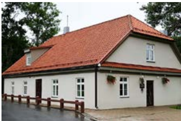
Kuldīgas Aļeternatīvās sākumskolas Padures filiāle

Børn og lærere i de lettiske landsbyskoler frygter regeringens sparekniv.