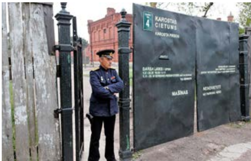
Havneområde i Liepaja

På færgen var der tryghed og besætning og passagerer spi-