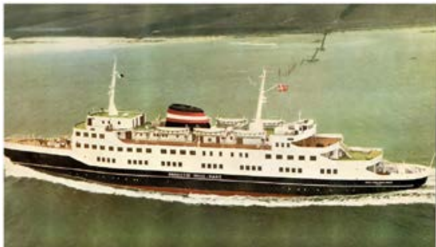
M/F Prinsesse Anne-Marie