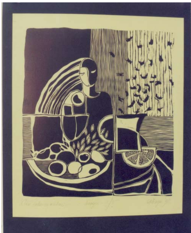
Klusa daba ar meiteni

(desværre yder bladet ikke fuld retfærdighed til værkerne idet farverne ikke kan gengives)