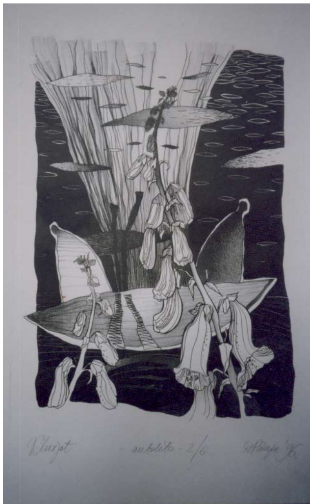
Klusejot af Dagnija Pārupe