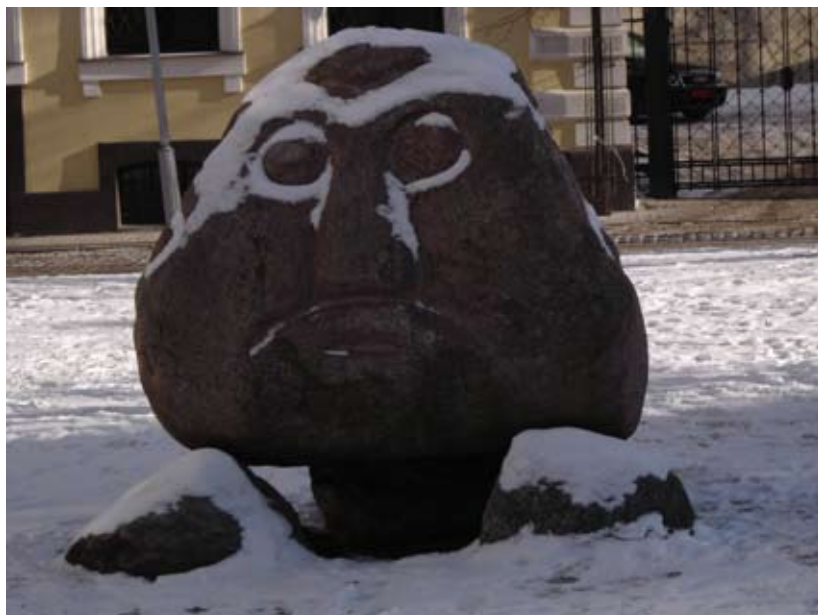
Vinterstemning i Riga.