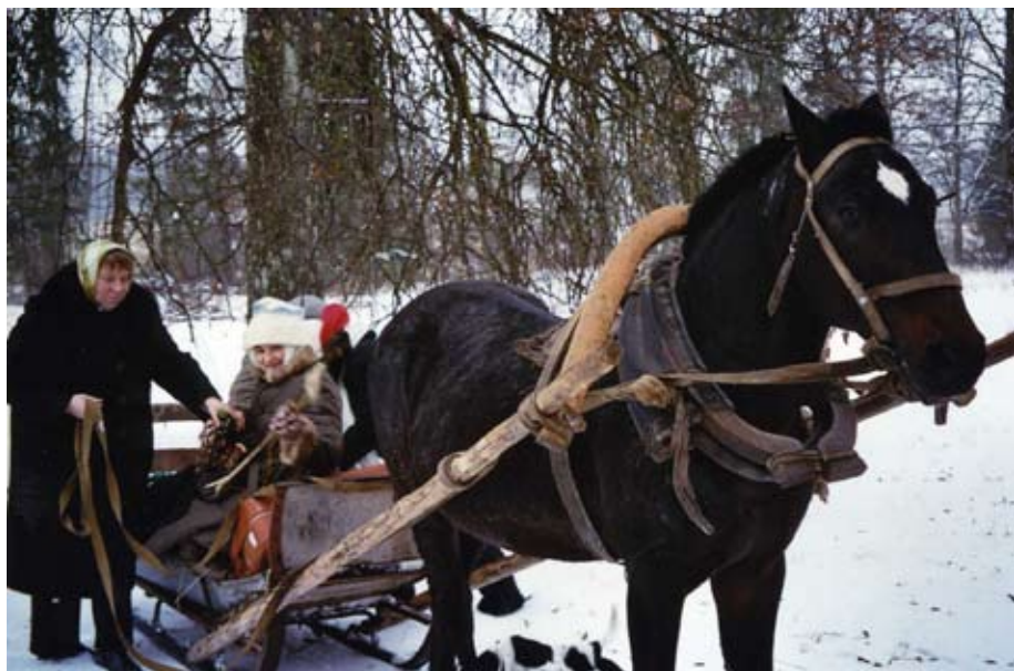
Kvinder på vej i kane til julefest på Rite Højskole.