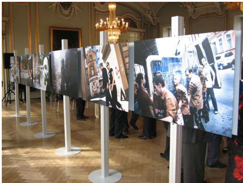
Billeder fra udstillingen