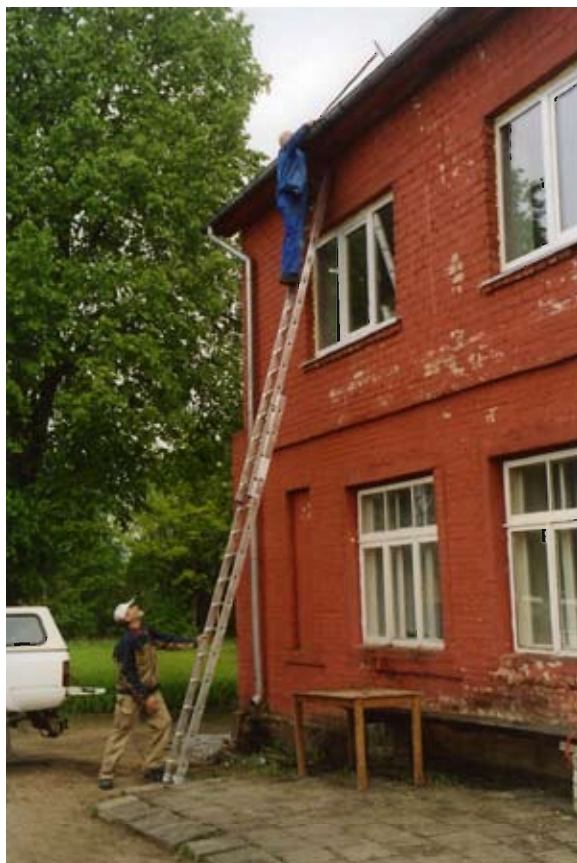
Aktive pensionister reparerer Rite Højskole.

Hen mod afslutningen af kurset, der havde 8-10 deltagere holdt skolen sin årlige generalforsamling. Her havde de ca. 30 deltagere lejlighed til at beundre resultatet af kurset, nemlig et smukt lyst lokale på 1. sal over spisesalen.