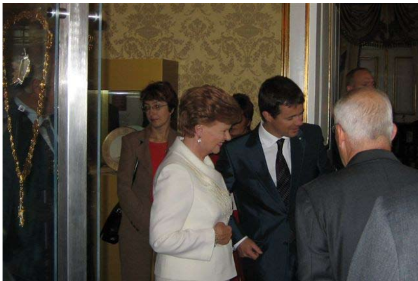
Kronprinsen og præsidenter betragter ordenerne

lands frihed og støttet landets videre udvikling. Udstillingen viser også den særlige orden, som gives til personer, der deltog ved barrikaderne i 1991. Ved udstillingen ligger et meget fint hæfte, som man blot kan tage med sig, hvori de enkelte ordener beskrives nøjere, og hvor der er fotos af udstillingens ordener. Udstillingen kan ses i Amalienborg Museets åbningstid til den 24. september 2006.