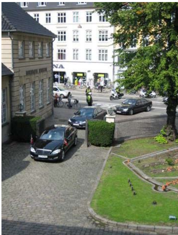
Præsidenten ankommer til Bymuseet