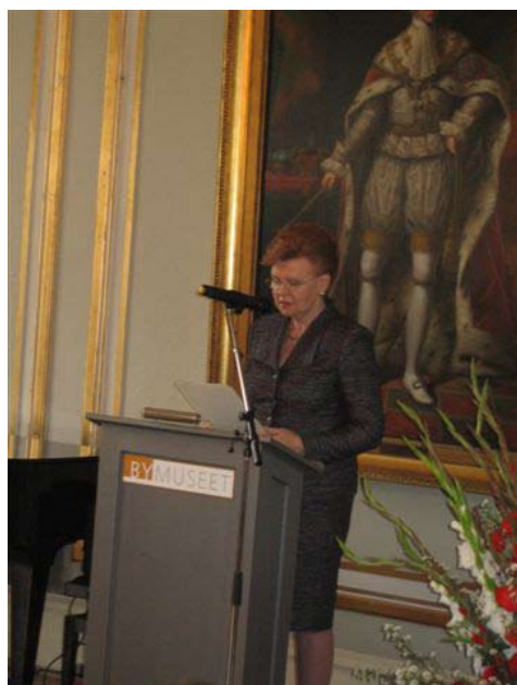
Præsidenten åbner udstillingen