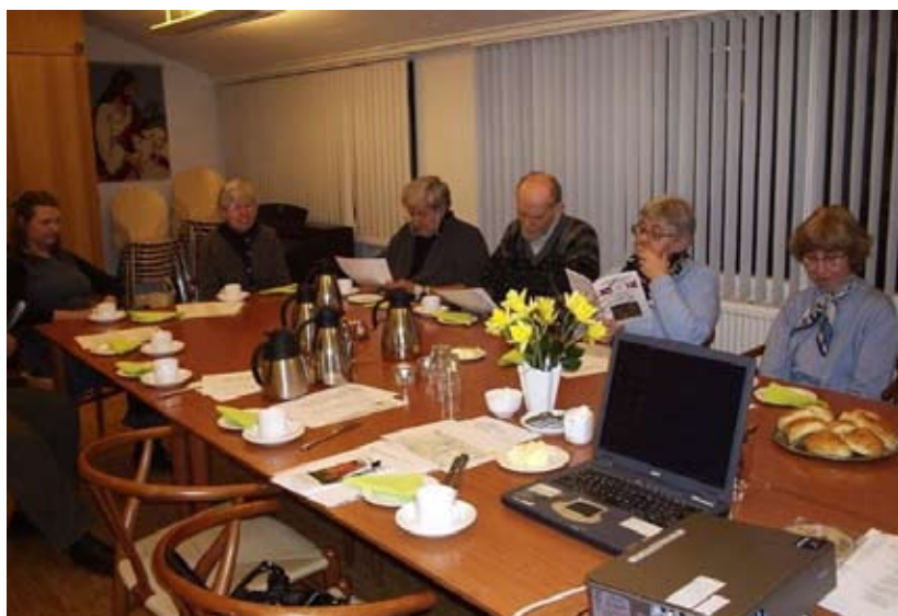
Årsmødet i Rite Højskoles østre støttekreds