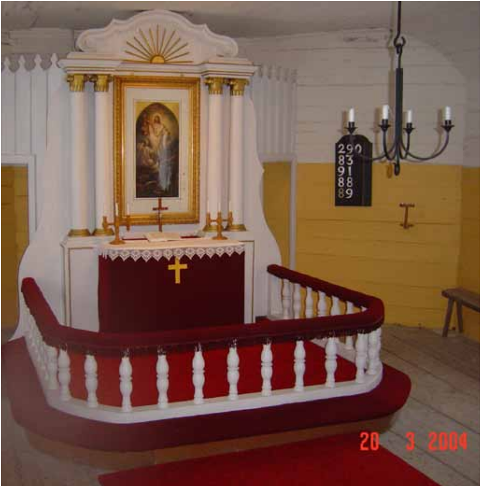
Taurene Kirkes alter