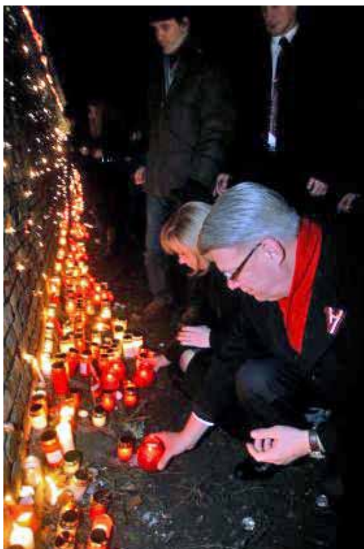
Præsident Valdis Zatlers med ægtefælle placerer stearinlys på Lačplešis Dag

Forenede Russisk - tyske styrker angreb med 55 000 mand mod 10 622 lettiske soldater og