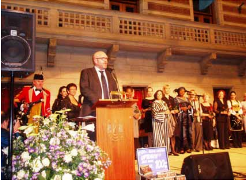
Borgmester Klaus Bondam holder festtale