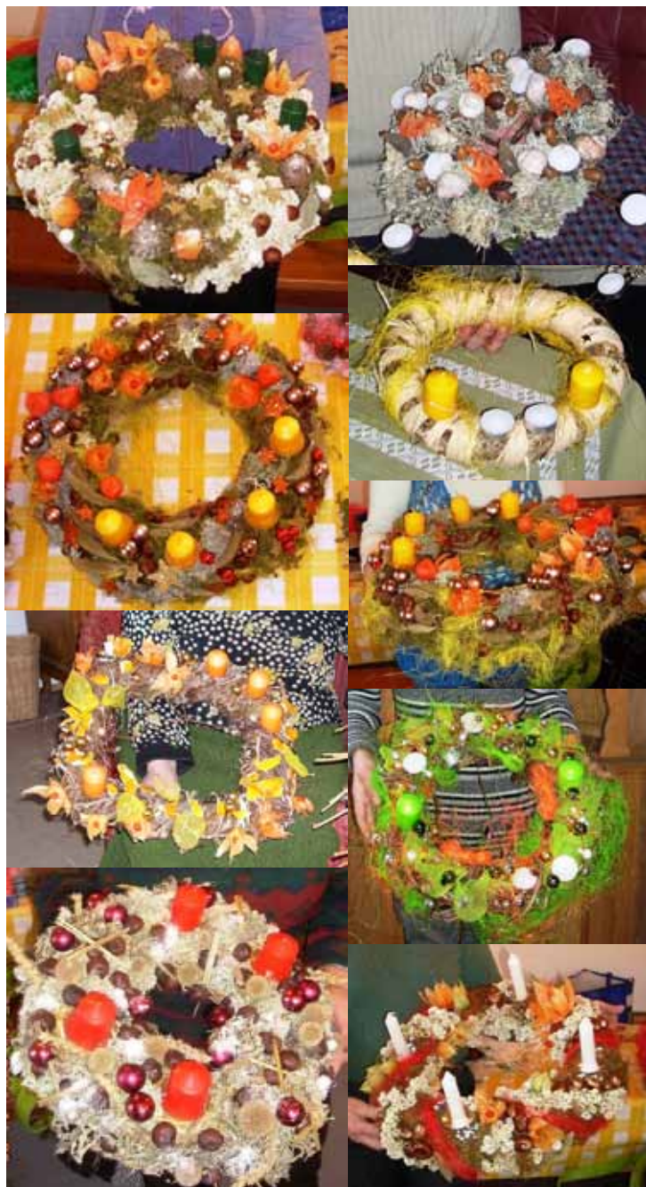
Adventskranse lavet på julekursus på Rite Højskole