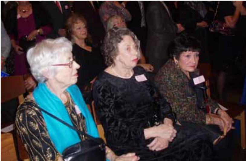
Prinsesse Elisabeth var blandt gæsterne