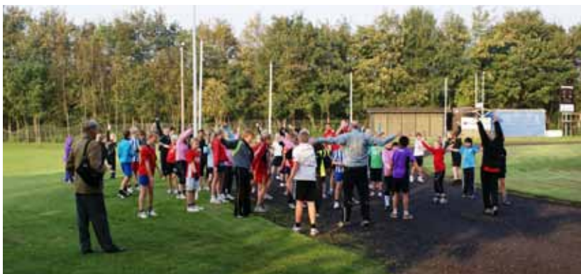
Seniorer i idræt på Paarup skole

De fire seniorer på Paarup Skole, har tidligere arbejdet i en bank, været møbelsnedker, ingeniør og skolesygeplejerske.