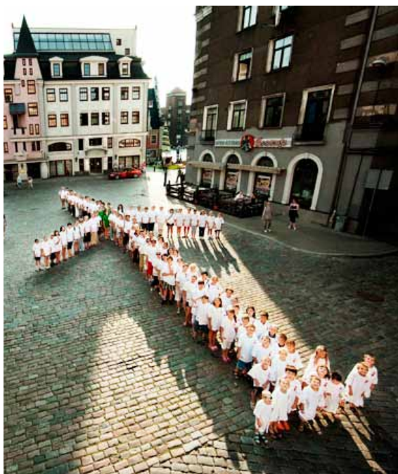
Menneskevindmølle i det centrale Riga.

Bæredygtige samfund er sat højt på dagsordenen i Riga. Bæredygtige samfund skabes af mennesker, der går sammen med et fælles mål om at skabe noget bedre. For at symbolisere dette fik DKI godt 100 letter til at "bygge" en vindmølle af deres kroppe på en af Rigas centrale pladser. "Bygningen" blev forevigt af fotograf Miklos Szabo (se ill.). Hæppeningen vakte betydelig opmærksomhed i bybilledet og i de lettiske medier. Dette blev afholdt i tilknytning til, at udstillingen 'Building Sustainable Communities' vistes i juli og august på Rigas Rådhus. I forbindelse med udstillingen afholdtes et panbaltisk seminar om at skabe bæredygtige miljøer i de store sovjetbyggerier, der præger periferien af alle større baltiske byer. De tre verdenskendte arkitektfirmaer BIG, Vilhelm Lauritzen og Site holdt foredrag for den lettiske miljøminister og arkitekter, regeringsrepræsentanter, kommunale folk og erhvervslivsrepræsentanter.