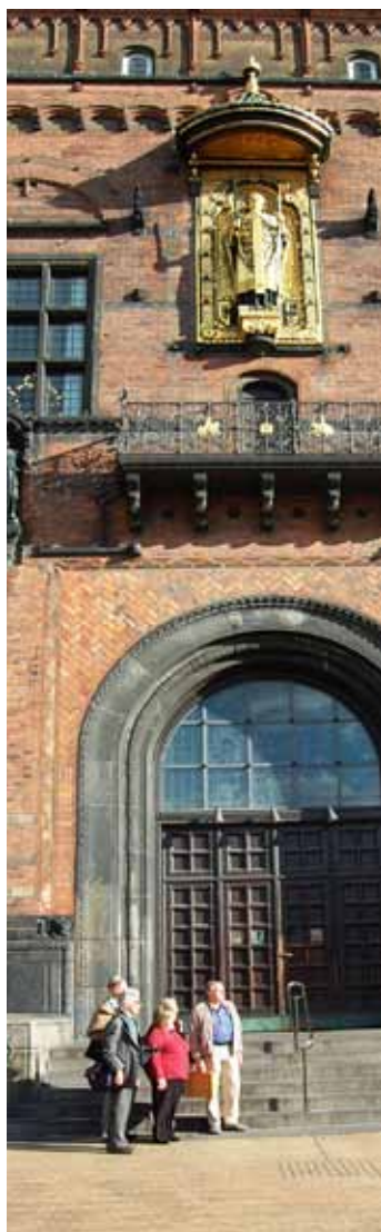
Gruppen ved Københavns Rådhus