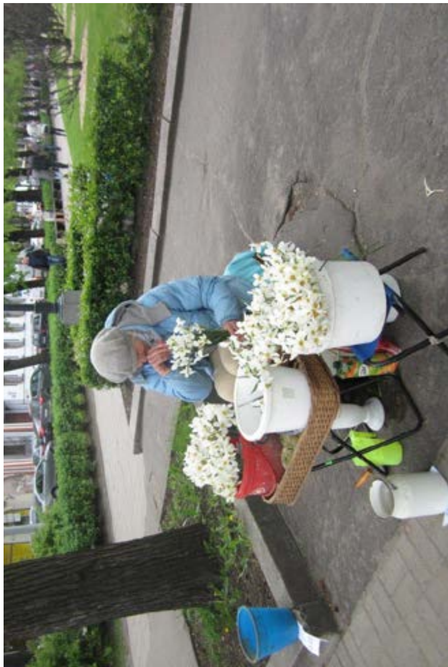
Der sælges pinsetiljer i Daugaupils.