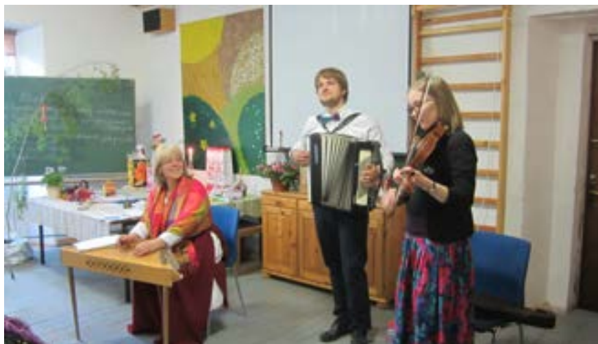
Mor, søn og svigerdatter spiller til jubilæet.

fales at vende tilbage, for der er meget at se i denne storby. Vi sagde farvel til Riga og kørte med bus til Rundale Slot, som er beliggende nær byen Bauska. Vi spiste god frokost på Café "Balta Maja". Herefter var der rundvisning på slottet og i parken. Der var skønne tulipaner i den store park, som man er ved at renovere. Da vi havde forladt Riga, ændrede landskabet sig mere og mere. Vi kom til åbne marker, langt mellem træhusene, og på en mark så vi 26 storke! Efter slotsbesøget gik turen mod Rite Højskole. Vi havde et kort stop i Nereta, som ligger 10 km. fra højskolen. Vi havde mulighed for at se den lokale købmand og foretage lidt indkøb.