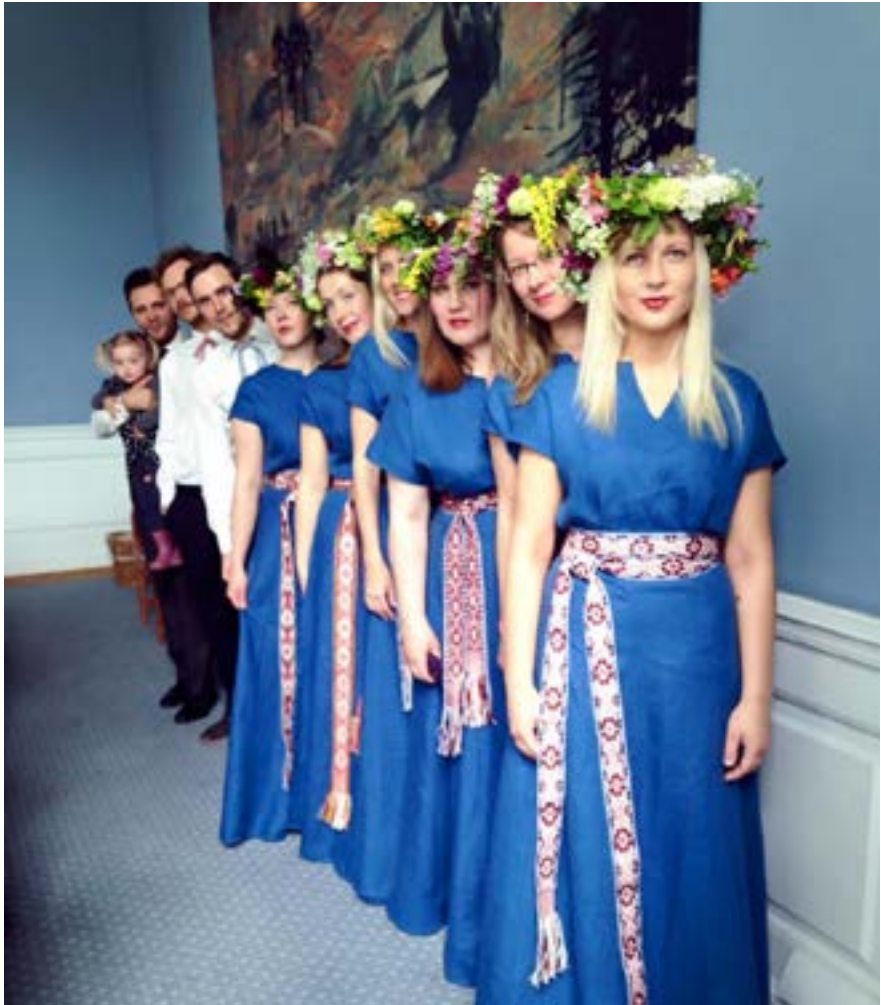
Københavns Lettiske Kor sang i Landstings salen på Christiansborg