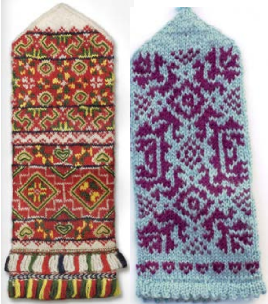
Vanter fra Zemgale og Latgale