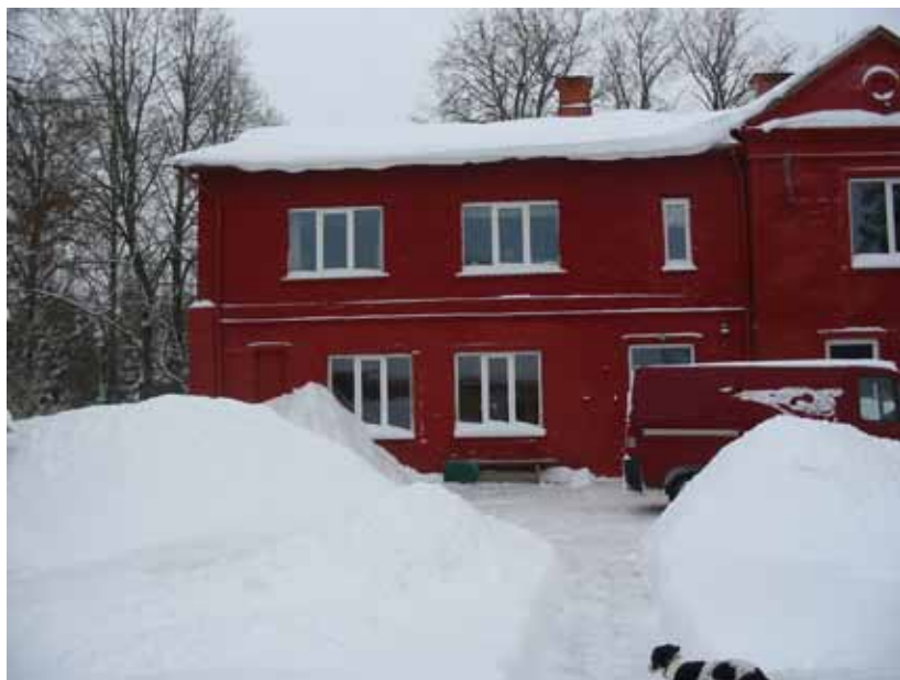
Rite Højskole i sne