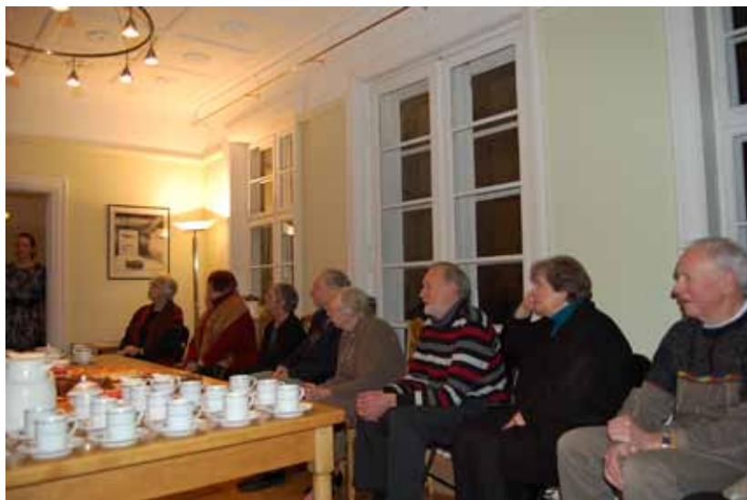
Foreningens medlemmer lytter interesseret til ambassadøren

Efter 2 timers hyggeligt samvær sluttede mødet med, at ambassadøren ønskede, vi igen kunne mødes og bruge hinanden i et frugtbart samarbejde.